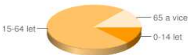
Rozložení věkových skupin

Přestože počet obyvatel roste a přicházejí mladí lidé, věkové poměry v zásadě odpovídají relativně nepříznivé situaci v regionu – populace stárne.